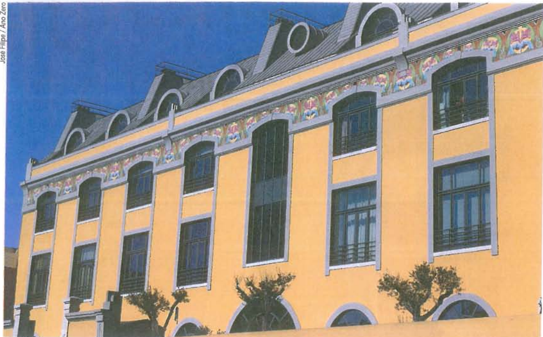
Edifício histórico renovado para um conceito arquitectónico moderno